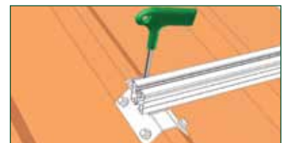
➌ Beim KlickTop lediglich aufsetzen und Imbusschraube von oben festziehen. Bei Standardausführung mit 2 Schrauben M10 und Muttern befestigen.