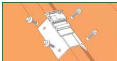
➊ Schelle auflegen