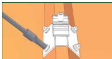
➋ Verschrauben mit selbstbohrenden Schrauben - auf leichte Pressung der Dichtung achten - bei größeren Stückzahlen mit Tiefenanschlag arbeiten